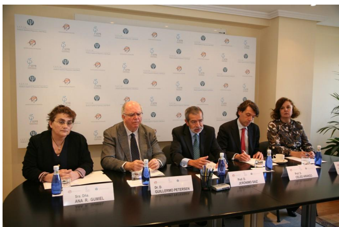
Momento de la rueda de prensa ofrecida por la SEP, la SEPB y la FEPSM.

La SEP, la SEPB y la FEPSM apoyan la Declaración de Madrid contra el Estigma y la Discriminación de las Personas con Enfermedad Mental. La Sociedad Española de Psiquiatría (SEP), la Sociedad Española de Psiquiatría Biológica (SEPB) y la Fundación Española de Psiquiatría y Salud Mental (FEPSM) han hecho público en una rueda de prensa su apoyo a la Declaración de Madrid contra el Estigma y la Discriminación de las Personas con Enfermedad Mental que el pasado 11 de enero anunció la Presidenta de la Comunidad de Madrid, Esperanza Aguirre.